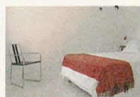
Descanso. Estancia del acogedor Hotel Mi Casa en Lisboa.

Se puede pasar la mañana haciendo un recorrido clásico por la zona de los Jerónimos y Belém. En el Monasterio de los Jerónimos, la obra maestra del estilo manuelino portugués, descansan los cuerpos de Vasco de Gama y Luis de Camoes bajo espectaculares monumentos funerarios. La entrada cuesta 5 euros. También se ha de