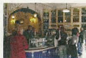
Dulces. Interior de la Antiga Confeitaria de Belém.

visitar la Torre de Belém (4 euros) para luego descubrir novedades como el Museo de Oriente, en la Avenida de Brasilia. Allí se pueden descubrir tesoros olvidados de las colonias asiáticas y entender las claves de la interrelación cultural entre pueblos tan distintos. El acceso cuesta otros 4 euros.